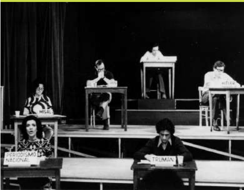
Puesta en escena de Operativo: "Pacem in Terris", 1972. Adaptación de palabras ajenas por Pedro Asquini en el Teatro Larrañaga, Buenos Aires.

La presente edición de EXPERIMENTA/Sur es producida por Mapa Teatro, en colaboración con la Dirección Nacional de Patrimonio Cultural; la Maestría Interdisciplinar en Teatro y Artes Vivas, la Facultad de Artes y la Facultad de Ciencias Humanas de la Universidad Nacional de Colombia.