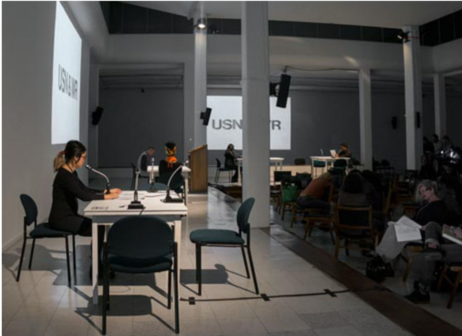
Jorge Cortés /ARTERIA