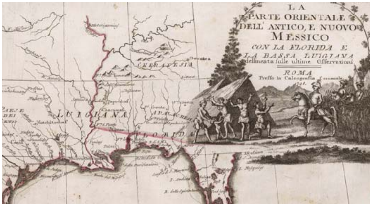
La parte orientale dell'Antico, e Nuovo Messico con la Florida e la lassa Luigiana (detail), Giovanni Maria Cassini, 1798