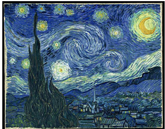
Vincent Van Gogh. La noche estrellada (1889)