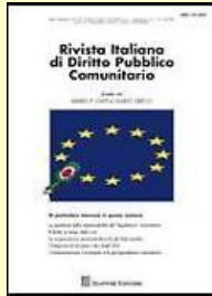
Rivista italiana di diritto pubblico comunitario. 6- 2019