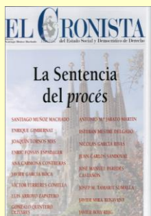
EL CRONISTA. NÚM 82-83 noviembre-diciembre 2019

¿Hay lugar para la esperanza? Muñoz machado, Santiago