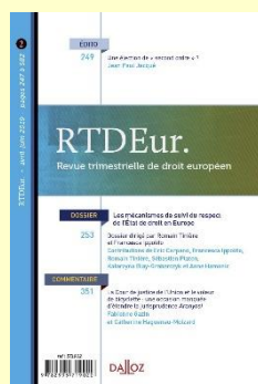
RTDeur. Revue trimestrielle de droit européen. Avril-juin 2019