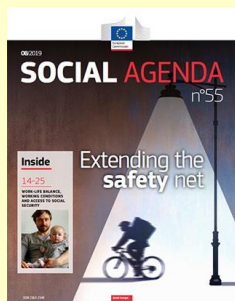
SOCIAL AGENDA n° 55