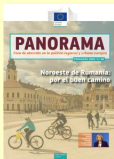
PANORAMA. N.º 68, primavera 2019

https://ec.europa.eu/regional_policy/sources/docgener/panorama/pdf/mag68/mag68_es.pdf