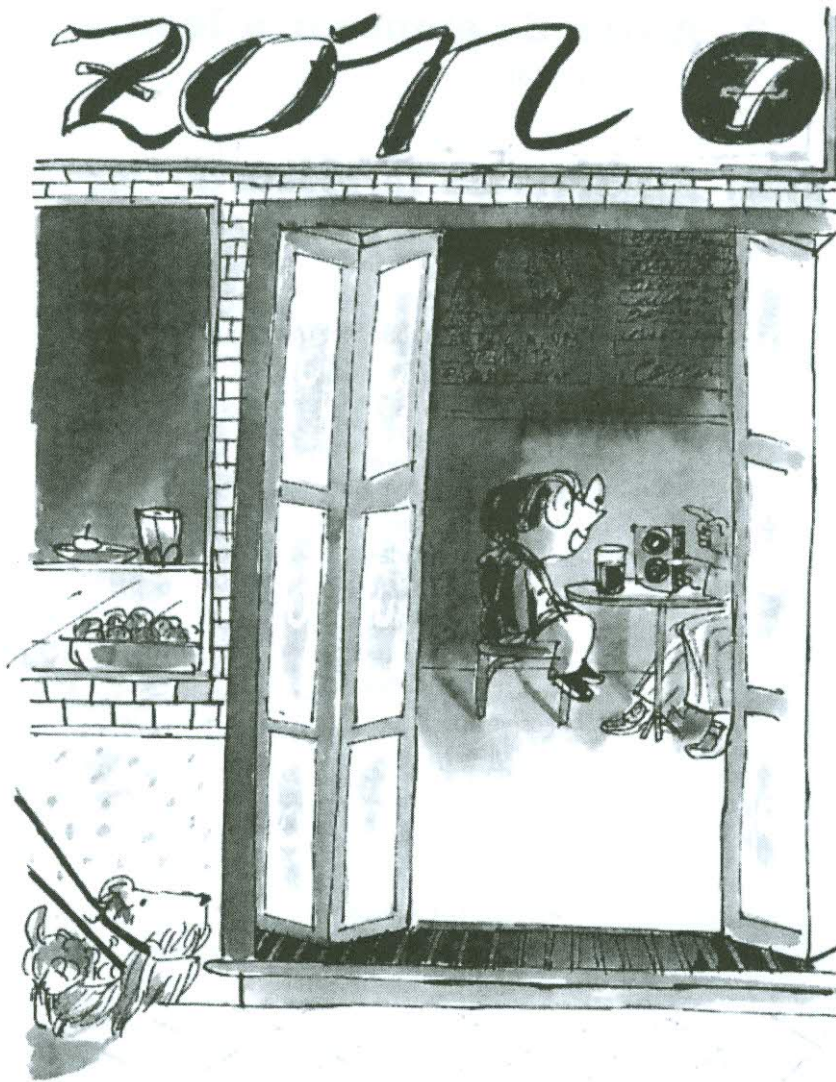
Elvira Lindo, casete en mano, sonsaca "sin piedad" a Manolito en El Tropezón.