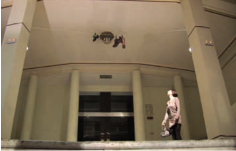
Ana Oliva Higuera, 2010. (Archivo propio).