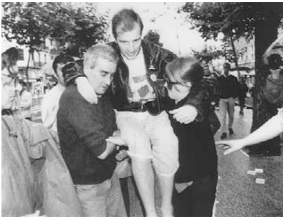
“Carrying” de Pepe Espaliú, 1993. (Archivo del artista).

incluían paradas en centros institucionales de salud, como el Ministerio de Salud, y centros de arte, con el MNCA Reina Sofía como punto final del itinerario. Dado el contexto, donde eran muchos los que renegaban del simple contacto de alguien con SIDA y el hecho de ser la homosexualidad el chivo expiatorio principal, estar presente, simplemente mirando, suponía ya una participación. Dice Puelles (2011) que quien se decide a participar de la relación estética adopta un “comportamiento” conducido por la voluntad de dejar que sea el otro quien se muestre 38 . Con solo ese dejarse llevar físicamente, el artista logró que los espectadores abandonaran su papel y ellos mismos se mostraran. De esta manera se produjo un desplazamiento en el estatuto del espectador asistente desde una relación estética hasta una relación ética: dejaba de ser propiamente espectador para convertirse en sujeto de la acción.