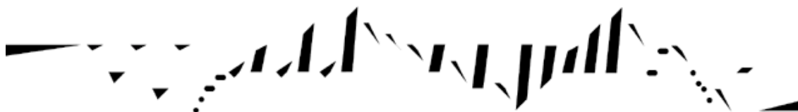
Brandenburg 3_

echa de pedazos cuyas uniones, cuyas reconstrucciones, generan un know-how 4 , un trayecto, una historia, una memoria... en definitiva, una definición de un presente que se construye y reconstruye continuamente, aprendiendo, sufriendo, disfrutando, experimentando... esto es, creando.