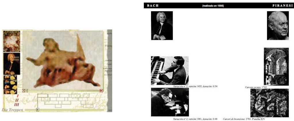
Fuge/Lemoine_ © Sylvia Molina 1996

quien sea... ¿de que 'tempo rubato' estaba yo hablando?, no, no voy a teorizar sobre esto ahora 7 . Sólo sigo escribiendo y disfrutando.