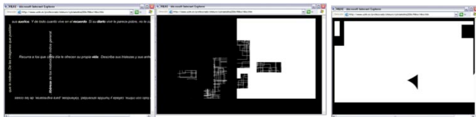
Rilke_ © Sylvia Molina 2004

Conferencia, si. Una breve explicación sobre mi trayecto a través de 4 obras: 'Brandenburg 3', 'Fuge/Lemoine' 'Bach-Piranesi' y 'Rilke' 8 . Doce años entre la primera y la última. Un momento Kintsugi , un momento de cerrar esa vasija. Pasan 8 años aún hasta que decida recoger este trayecto e implementarlo en mi aula. Transmitir esta sinestesia a los alumnos. Enamorarlos de nuevo entre dos artes que la institución quiso separar. Nace así en el 2012 el proyecto 'Poliedro' y lo que conllevó a 2013 'Poliedro Sinestésico'; 2014 'Panspermia Sonora. Tacto electroacústico'; 2015 'Panspermia Sonora. Tras el aroma de Oort' (Olfato). Aquí les dejo los enlaces y disfruten Vds. mismos de todo ello: