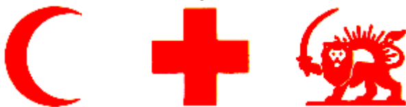
Fig. 2 : Signos distintivos en color rojo sobre fondo blanco.

2. De noche o cuando la visibilidad sea escasa, el signo distintivo podrá estar alumbrado o iluminado; podrá estar hecho también con materiales que permitan su reconocimiento gracias a medios técnicos de detección.