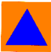
Fig. 4: Triángulo azul sobre fondo naranja

1. El signo distintivo internacional de protección civil previsto en el párrafo 4 del artículo 66 del Protocolo será un triángulo equilátero azul sobre fondo naranja. En la figura 4, a continuación, aparece un modelo.