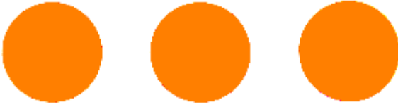
Fig. 5: Signo internacional especial para las obras e instalaciones que contienen fuerzas peligrosas

4. De noche o cuando la visibilidad sea escasa, el signo podrá estar alumbrado o iluminado. Puede estar hecho también con materiales que permitan su reconocimiento gracias a medios técnicos de detección.