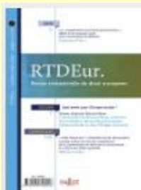
RTDEur. Revue trimestrielle de droit européen. Dalloz. N° 1/2018.